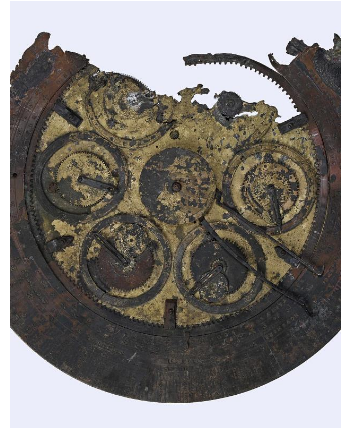
N. Valerius, Äquatorium, 1564 (MPS, Inv.-Nr. C II 10)

Von diesen frühen Zahnradmechanismen ist so gut wie nichts erhalten, sodass die Wiederentdeckung oder Neuanalyse jedes derartigen Instruments von Interesse ist. Ein solches Äquatorium aus Messing mit gleichzeitiger Anzeige der „wahren“ Position aller sieben klassischen Planeten im Tierkreis wurde 1564 vom Coburger Mathematiker Nikolaus Valerius an den sächsischen Hof geschickt. Nach dem Bombenangriff auf Dresden 1945 ist es nur noch als entstelltes, verbranntes Fragment erhalten; es wurde aber auch vor dem Zweiten Weltkrieg nie einer umfassenden Analyse unterzogen. Der reich illustrierte Vortrag beschreibt die vielen Schritte, die unternommen wurden, um mit digitalen Mitteln zu analysieren und zu rekonstruieren, was dieses Äquatorium einst zeigte – und möglicherweise zu welchem Zweck es auch diente.